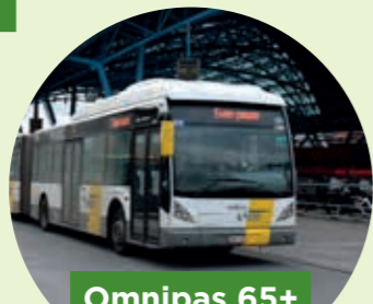
Omnipas 65+ abonnement bij De Lijn

Geen zin meer om je met de wagen in het drukke verkeer te wagen? Maak dan gebruik van het openbaar vervoer. Halle is een mobiliteitsknooppunt en daar kan jij je voordeel mee doen.