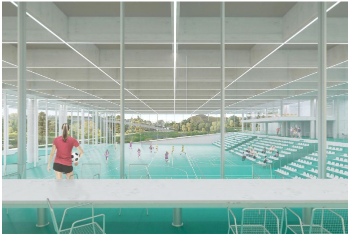
De grote sportzaal met zicht op het Zennepark