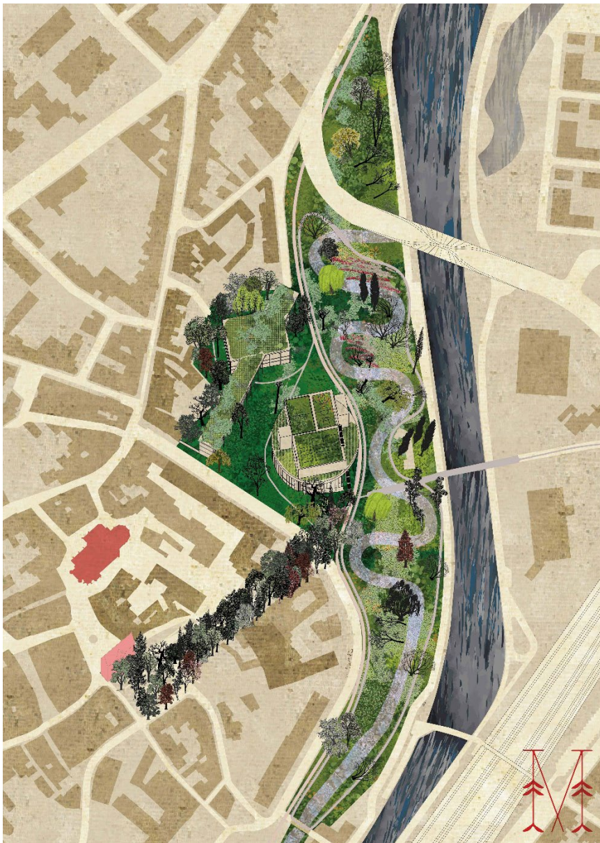
Bovenaanzicht van het Zennepark met meanderende Zenne